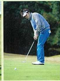
グリーン上でも集中力が落ちない

にもいいと思います。それにNIを飲んでいただけいか、プレー後に疲れをあまり感じません。これなら明日の朝も疲れは感じないと思います。本当にいいものを教えていただき、ありがとうございました」