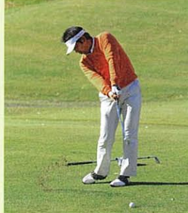
さすがにトップアマ。スイングの確かさに感心