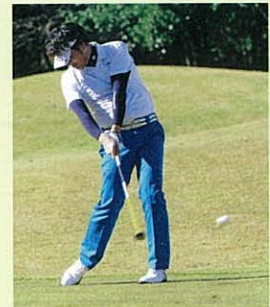
コンディショニングがいいとスイングにも張りが出る

ね。冬ゴルフの飲み物といえば、ホットコーヒーとかお汁粉しかなかったんですが、それらは甘すぎて気軽に飲めないです。よしと好感。」「外側を暖めてくれるのがインナーウエアだとしたら、ホット・リプレニッシュは、インナーサプリといえます。ゴルフは結構タフなスポーツです。アマチュアの方は(スイングで)カラダを必要以上に使ってしまうので、多方向にそれ相当量の負荷がかかってきます。筋肉が傷む、足がつかないなどいろいろ症状に表れるのがその証拠です。ホット・リプレニッシュなどでしっかりと予防することが大事です」 「ランチを食べるといつも集中力が途切れますが、今日は不思議と保たれています。これもリプレニッシュ効果だと思いますが、驚きです。アマチュアはプレーに集中しすぎてつい摂取を忘れてしまいがちですが、ティショットのルーティーンに入れちゃえばいいでしょうね」 「それはいい考えです。血液循環の効率がよくなるので、考える力が落ちません」 「ホット・リプレニッシュはゴルフだけじゃなく、登山や釣りに