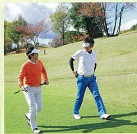
寒い中、ゴルフ談義に花が咲く