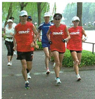
皇居周囲コースで確実にペースを刻む チャレンジャーたち