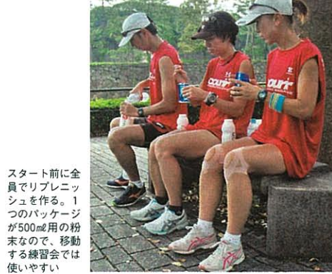
スタート前に全 員でリプレニッ シュを作る。1 つのパッケージ が500cc用の粉 末なので、移動 する練習会では 使いやすい