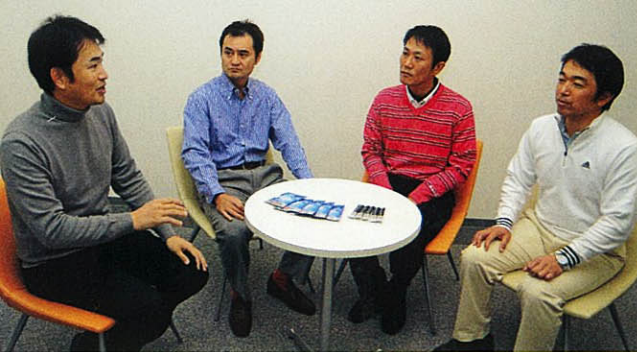
トップアマの方はどのコンディショニングの意識が高いですね(中井)

が、喉ごしがいいのと体の内部から温めてくれるので、寒さを忘れさせてくれます。本当はライバルに教えたくないのですが(笑)……。今ではゴルフに必ず持参するというルーティーン化しています。忘れたら落ち着かない。精神的な支柱になっていきますね。ジムでは水分補給が必要なので、肌身離さず持つて行きました。吸収力がいいので、負荷をかけても疲れが残らなくなりました。