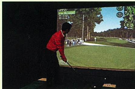
ゴルフは楽しく回れることがいちばん大事。対談終了後に参加者がシミュレーションゴルフでコミュニケーションの輪を広げた