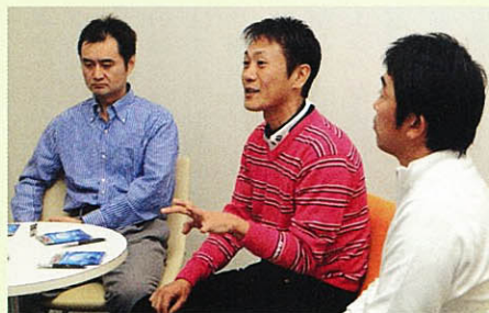
「疲れない、集中力が落ちない」と体験者の声

ポーツということをぜひ、認識していただきたいと思います。実際にフィジカル管理に目覚めたプロがきちんと成績を残しています。大、稲、岡 MUSASHI に出会ってから嘘偽りなく、そう思えるようになりました。素晴らしい体験をさせていただき、ありがとうございます。